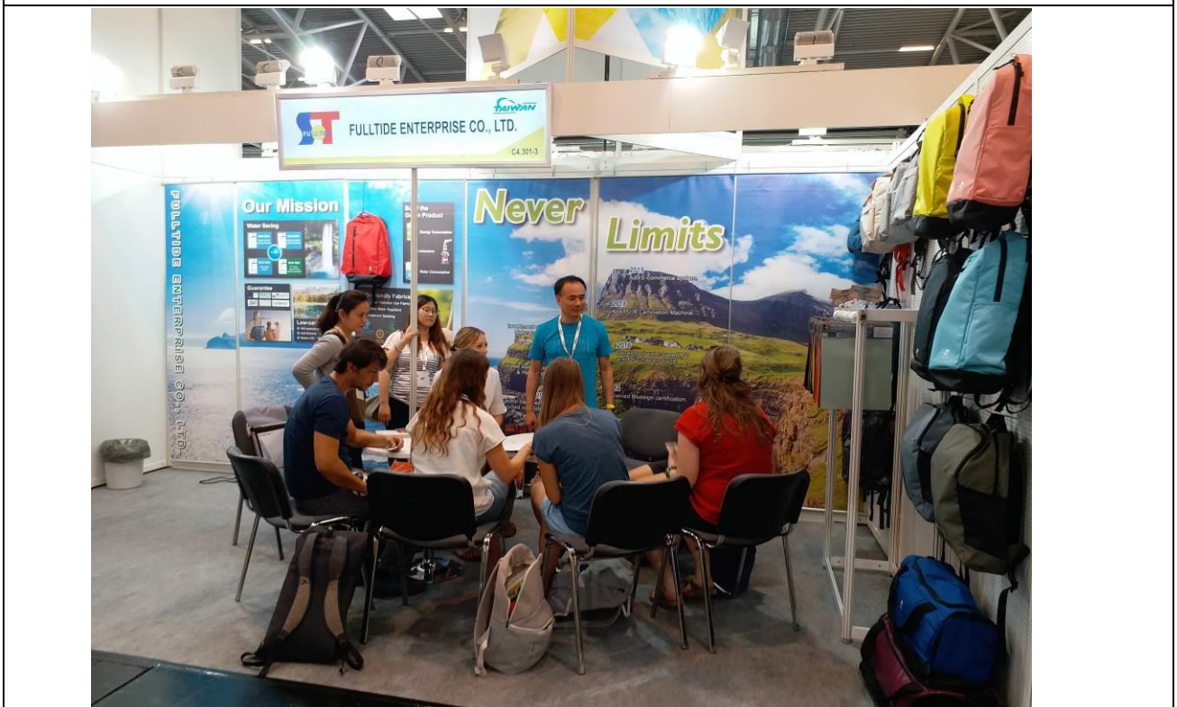
富泰公司接待買主情形