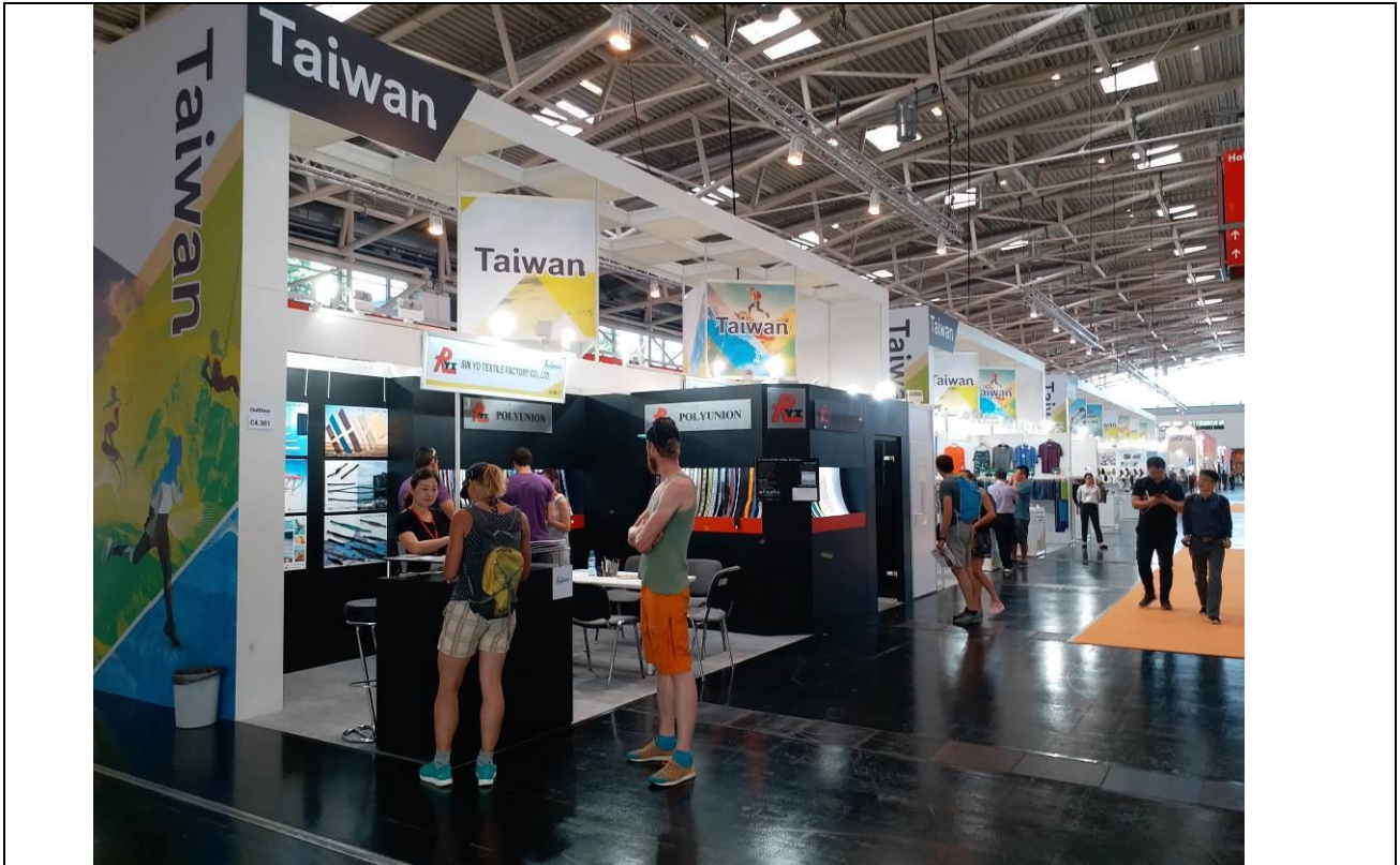
臺灣館形象造型開放明亮