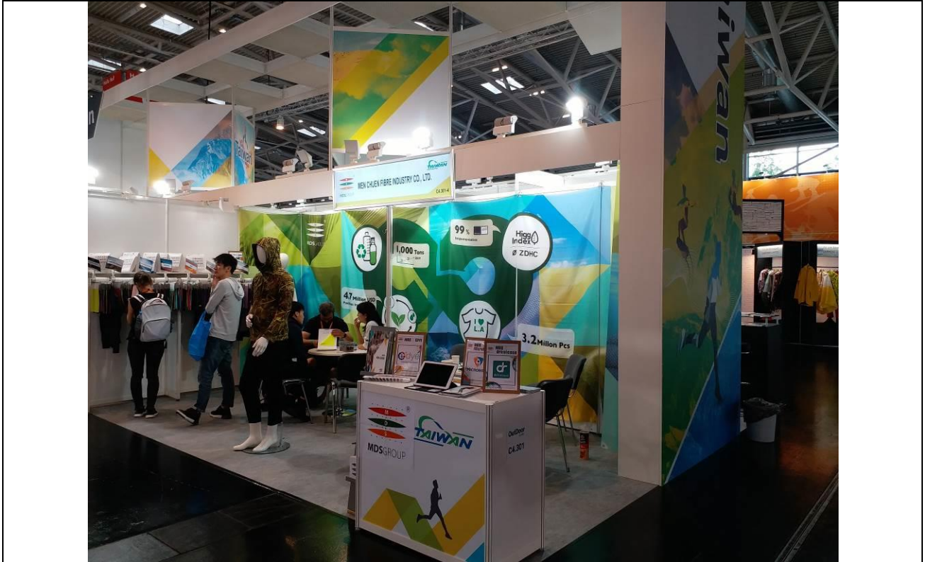
綿春公司接待買主情形