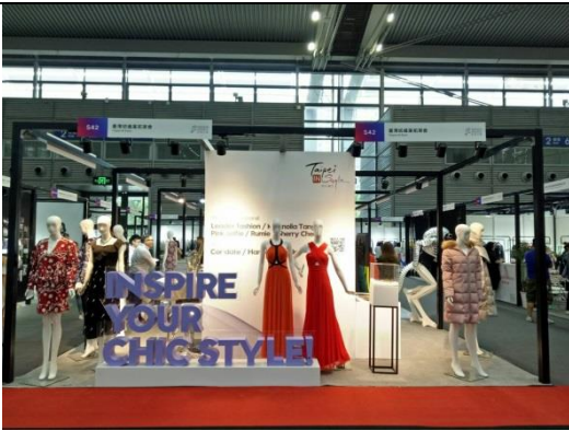
臺灣紡拓會 Taipei IN Style 形象區