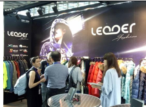
Leader Fashion Textile Co., Ltd. 展位洽談