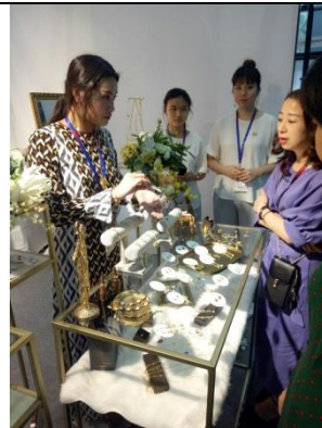
Hannah Jewelry 展位洽談