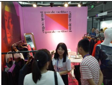
Pink selfie 展位洽談