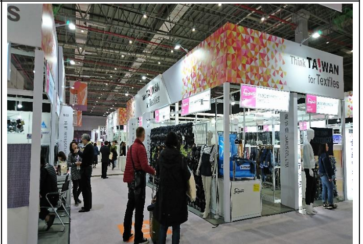
台灣館造型亮眼吸引買主