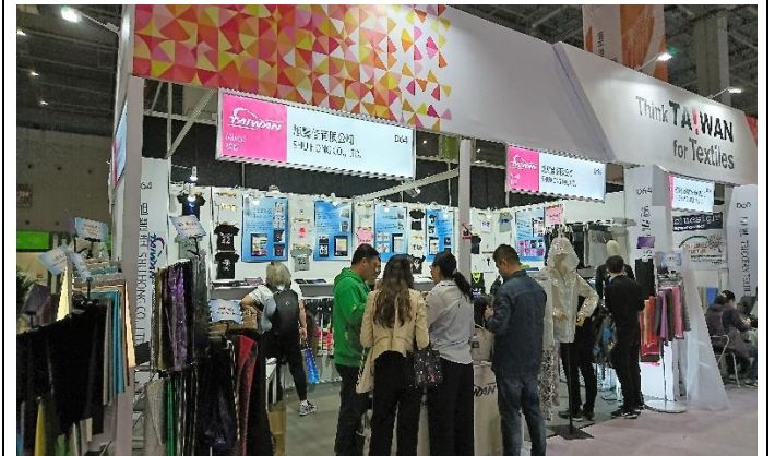
台灣館專業買主對接