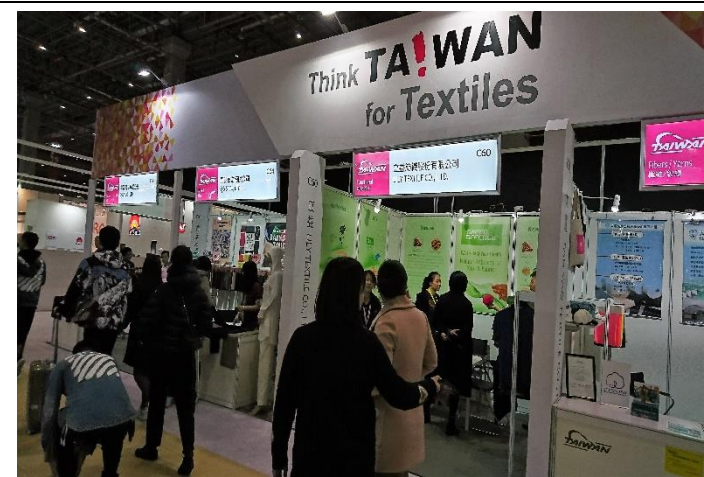
台灣館參觀買主眾多