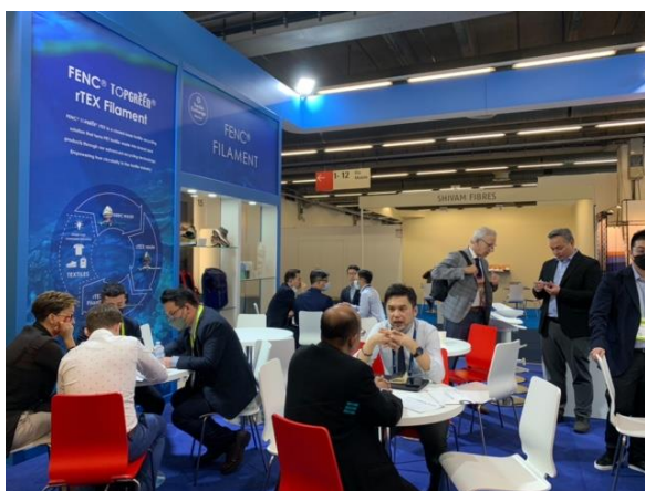
買主與臺灣館廠商洽談情形