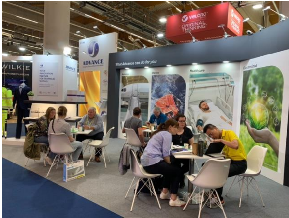
買主與臺灣館廠商洽談情形