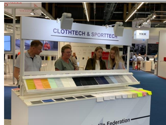
臺灣廠商精選紡織品聯合推廣專區吸引買主蒐尋