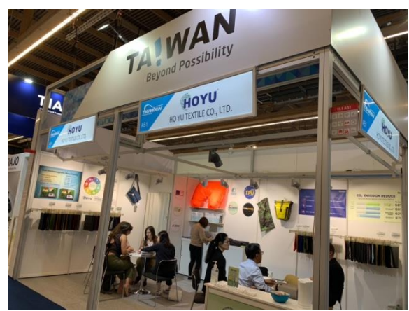
買主與臺灣館廠商洽談情形