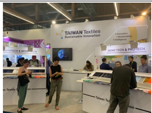
臺灣廠商精選紡織品聯合推廣專區吸引買主蒐尋