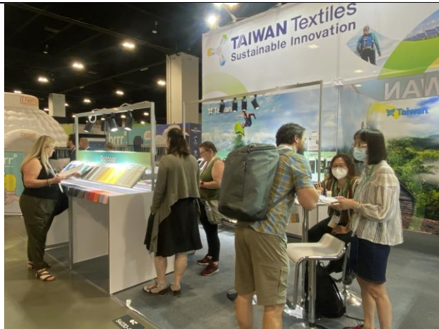
臺灣館形象區吸引買主蒐尋臺灣廠商展品