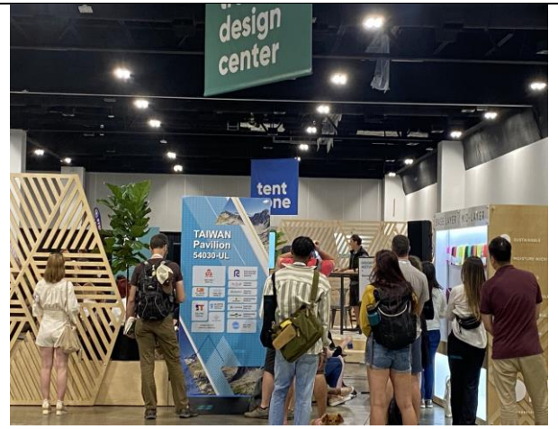
大會形象區入口處明顯的臺灣館立牌宣傳