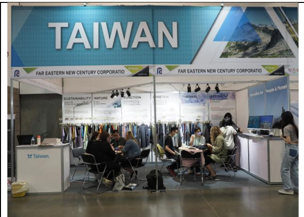
買主與臺灣館廠商洽談情形