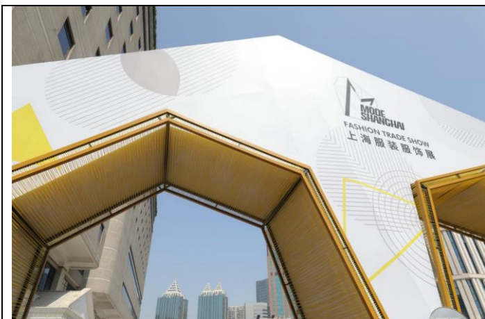
上海世貿商城入口形象