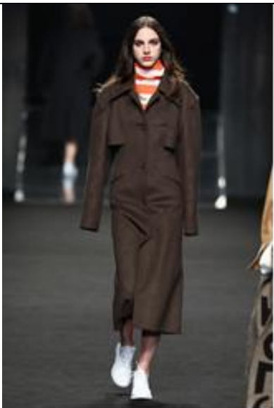
C+plus SERIES 2018AW