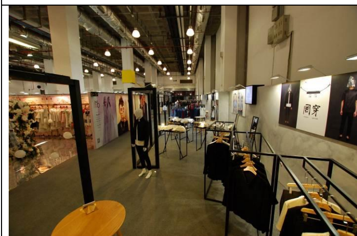
臺灣服飾品牌專區空景照