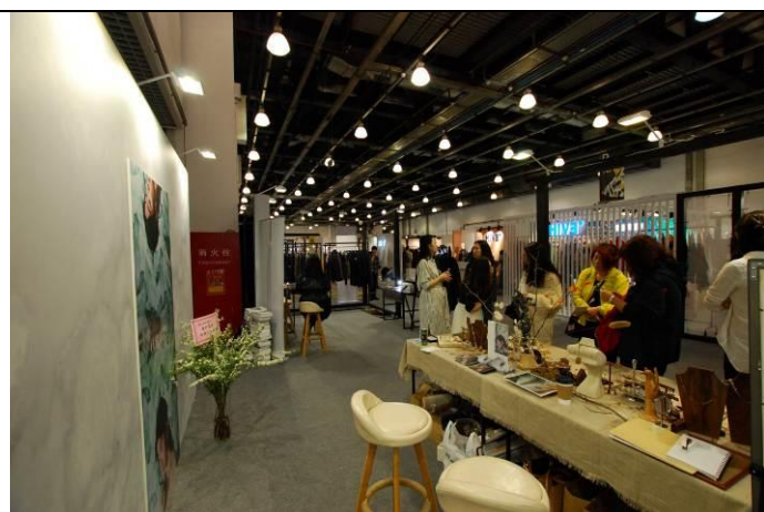
參展品牌 COR-DATE 接單踴躍