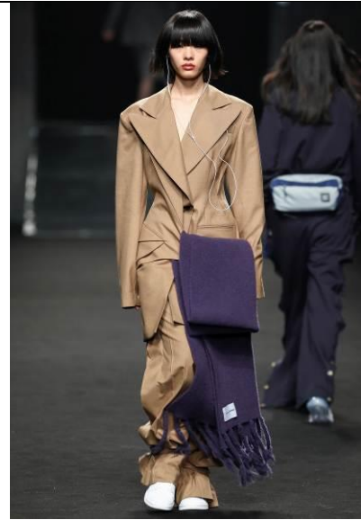
C+plus SERIES 2018AW