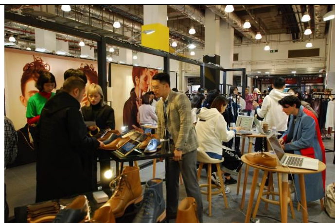
參展品牌 DAMUR 人潮不止