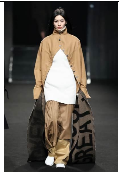
C+plus SERIES 2018AW