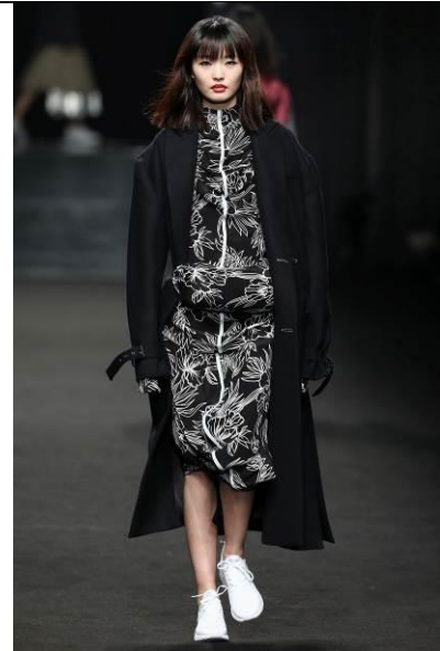
C+plus SERIES 2018AW