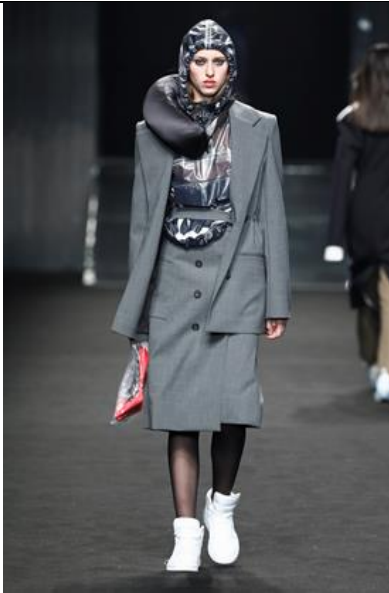
C+plus SERIES 2018AW