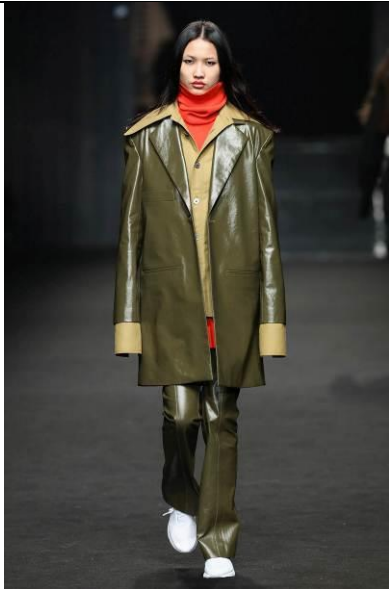
C+plus SERIES 2018AW