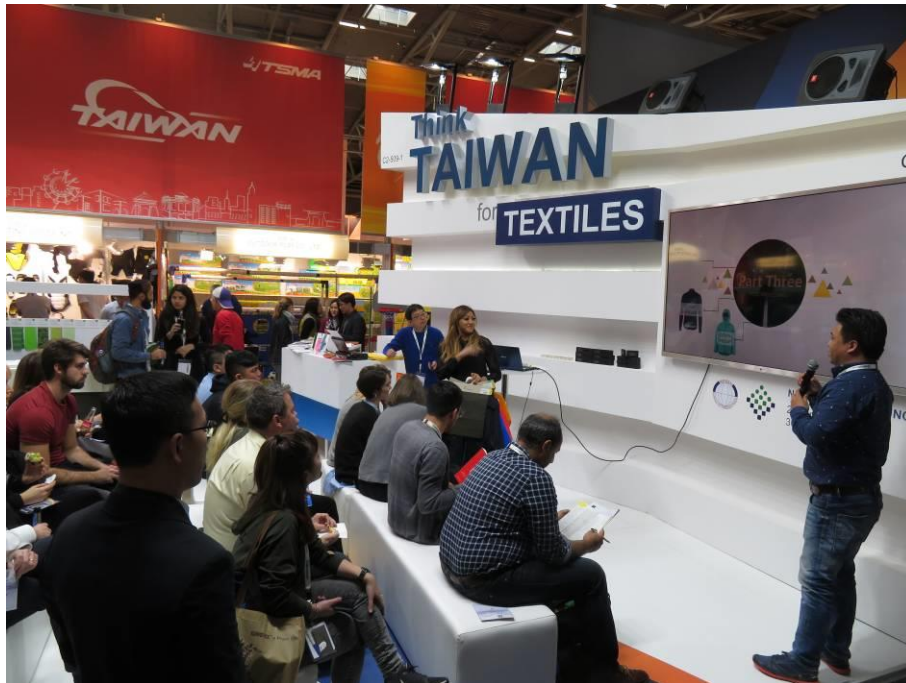
織宇在臺灣館形象區進行新產品發表