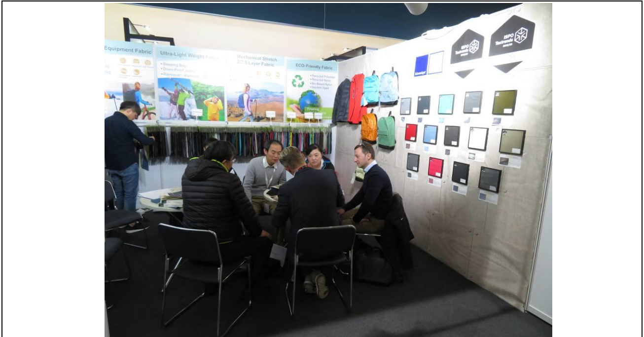
在 Soft Equipment 類別中獲得 Top 10 殊榮的弘裕企業 與國際買主商洽