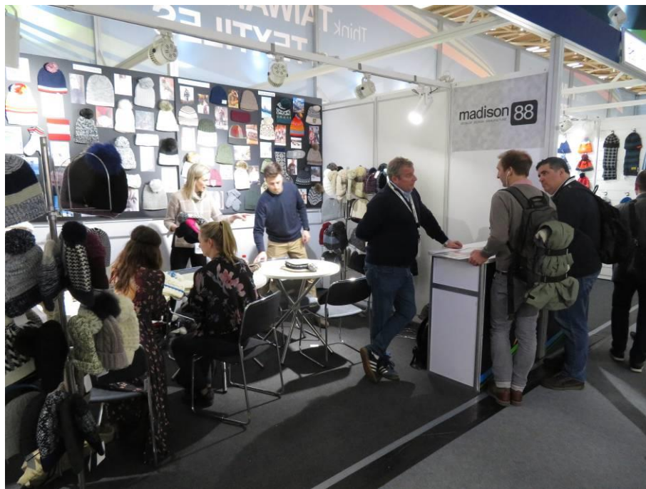
國際買主與佑環商洽