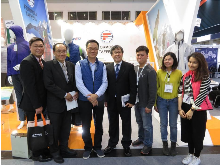
駐德國代表處謝大使志偉至臺灣展商攤位加油打氣