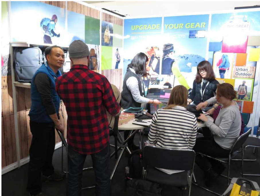
國際買主與富泰企業商洽