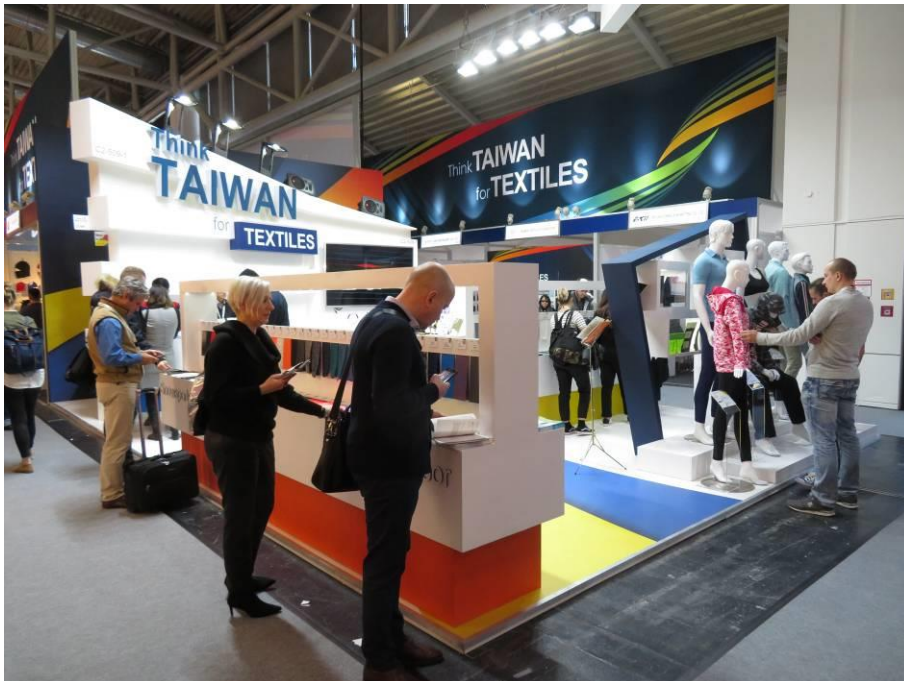
臺灣館形象區吸引買主駐足搜尋產品